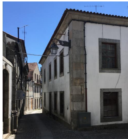
Alçado do gaveto da Rua dos Cavaleiros com a Rua Pintor