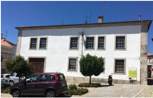
Alçado do Largo Luis Albuquerque e Ruas dos Cavaleiros.