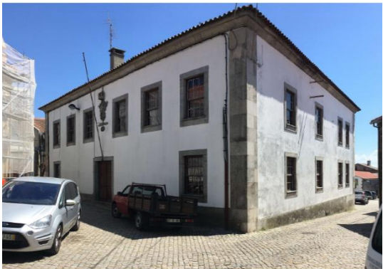
Alçado do gaveto da Rua Pintor e Rua Frei João Lucena