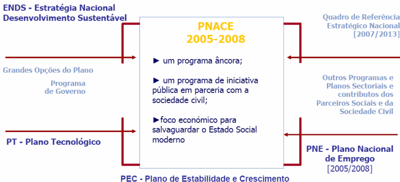
Fig. 1 – Estratégia de Lisboa

Neste capítulo encontram-se assim enunciados os Planos Nacionais que compõem a Estratégia de Lisboa, conforme Fig. 1, e outros que foram considerados igualmente importantes e orientadores das estratégias a seguir.